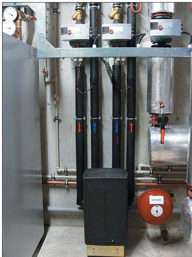
Předřazený výměník tepla pro klimatizaci