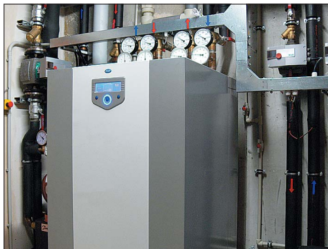
Tepelné čerpadlo odnímá teplo z vody vypouštěné z balneoprovozu a předpřipravuje teplou vodu, nebo ochlazuje vodu pro klimatizaci