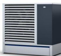
ECONOMIC 06 - 10