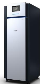
TERRA NEO 07 - 12